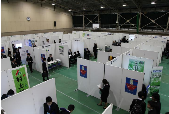
会場レイアウト図（平成 28 年度は 55 社が参加）