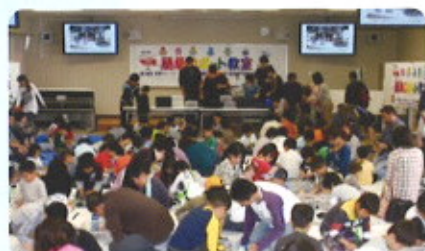
簡単プリント教室