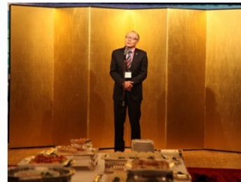
交流会で挨拶をされる西副会長