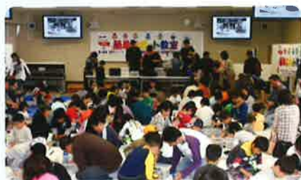
簡単プリント教室