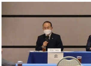
総会で挨拶をされる住田会長