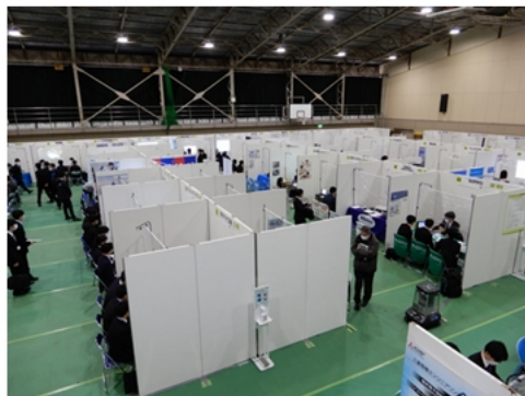
セミナー会場の様子